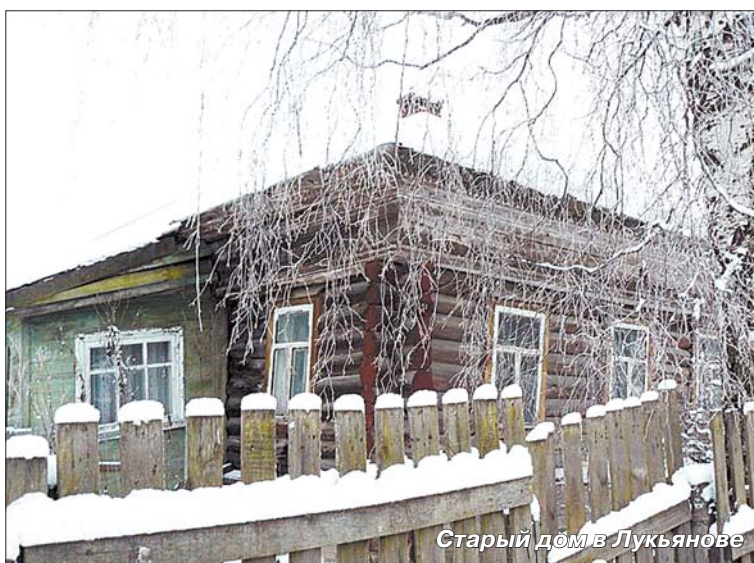
Старый дом в Лукьянове