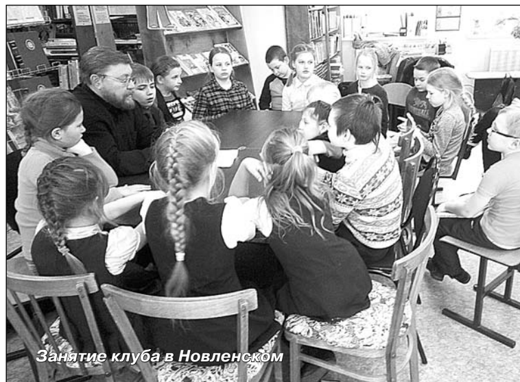
Занятие клуба в Новленском

миться с такими же читающими людьми. И что очень важно - есть заинтересованные