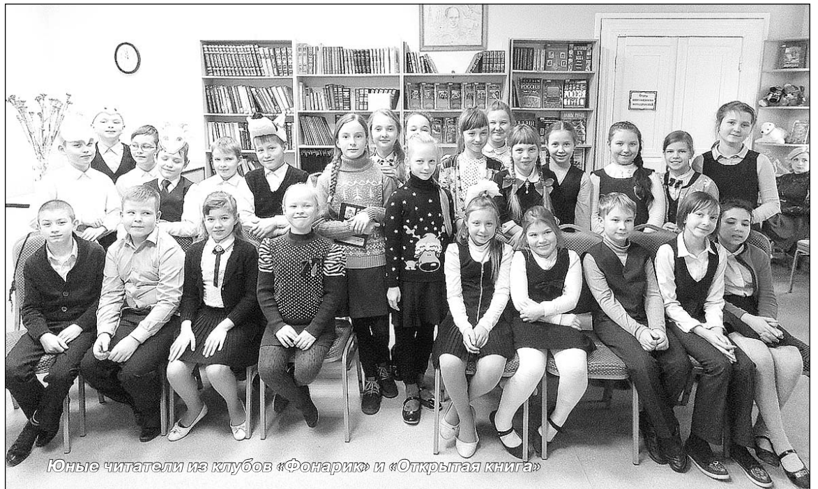
Юные читатели из клубов «Фонарик» и «Открытая книга»

Я думаю, что встречи клубов читающих детей будут и впредь, ведь это очень интересно: читать, играть, знако-